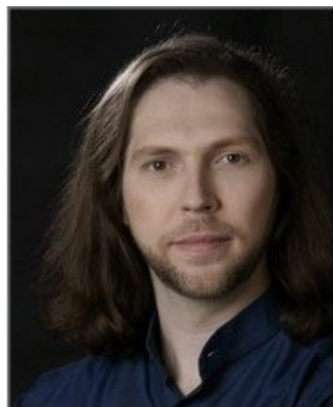
Felipe Bou

A la lista de destacadas voces que ha dado la inagotable cantera de cantantes líricos españoles podemos agregar la del bajo Felipe Bou.